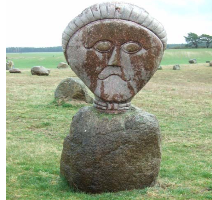
Gott Dagaz (Findlingspark Henzendorf)